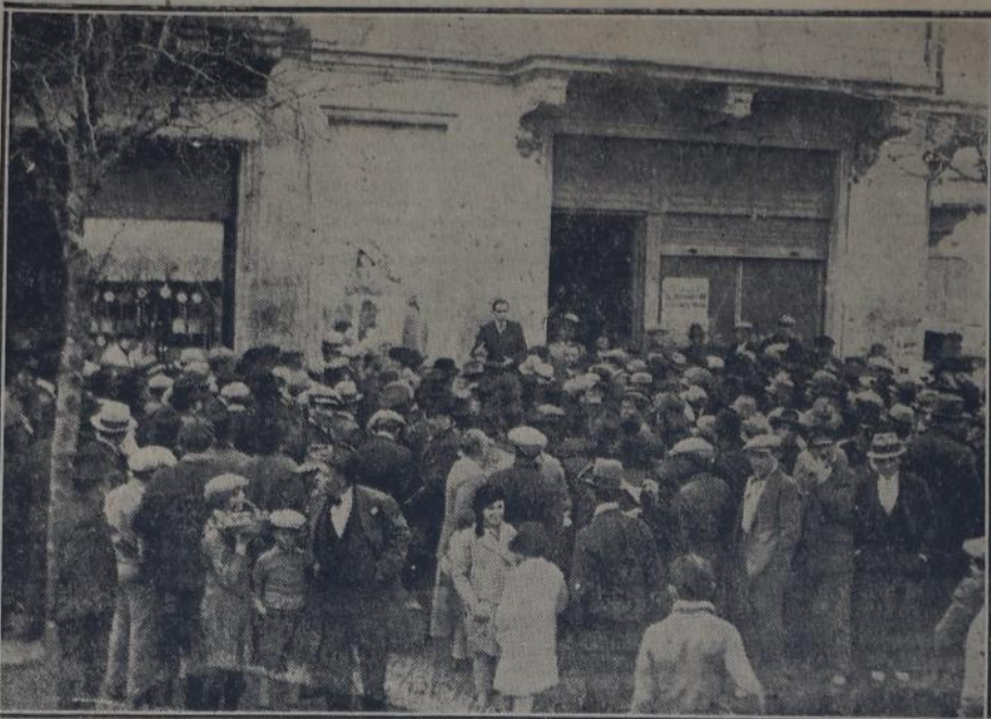
PARTE DE LA CONCURRENCIA ESCUCHANDO LA PALABRA DE UNO DE LOS ORADORES