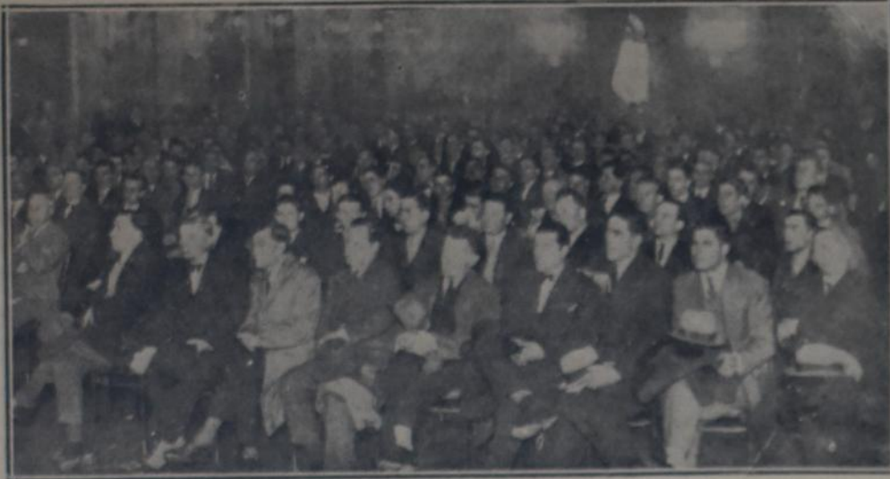
ASPECTO QUE PRESENTABA EL SALON DEL AUGUSTEO DURANTE LA ASAMBLEA

quien manifiesta que, mientras a la Federación Gráfica le asegura la inclusión de los tipógrafos, a los industriales se la niega. Analiza en seguida la nota enviada al Departamento nacional de trabajo por los industriales,